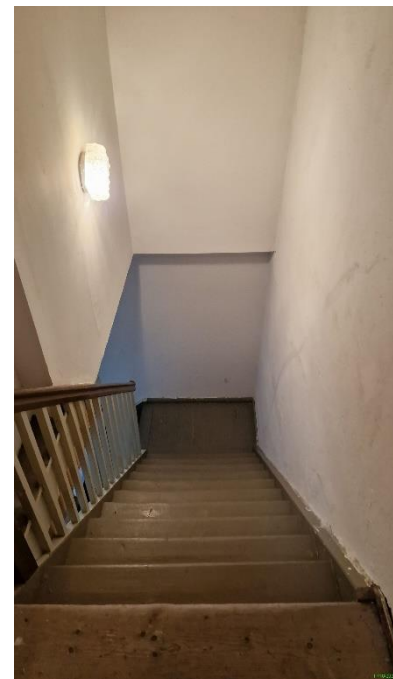
Treppe zum Bodenraum