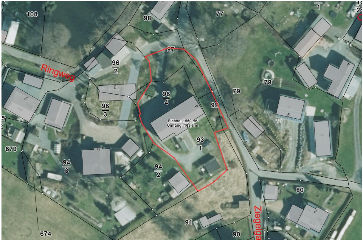
Luftbild (zukünftiger Grundstücksschnitt rot markiert)