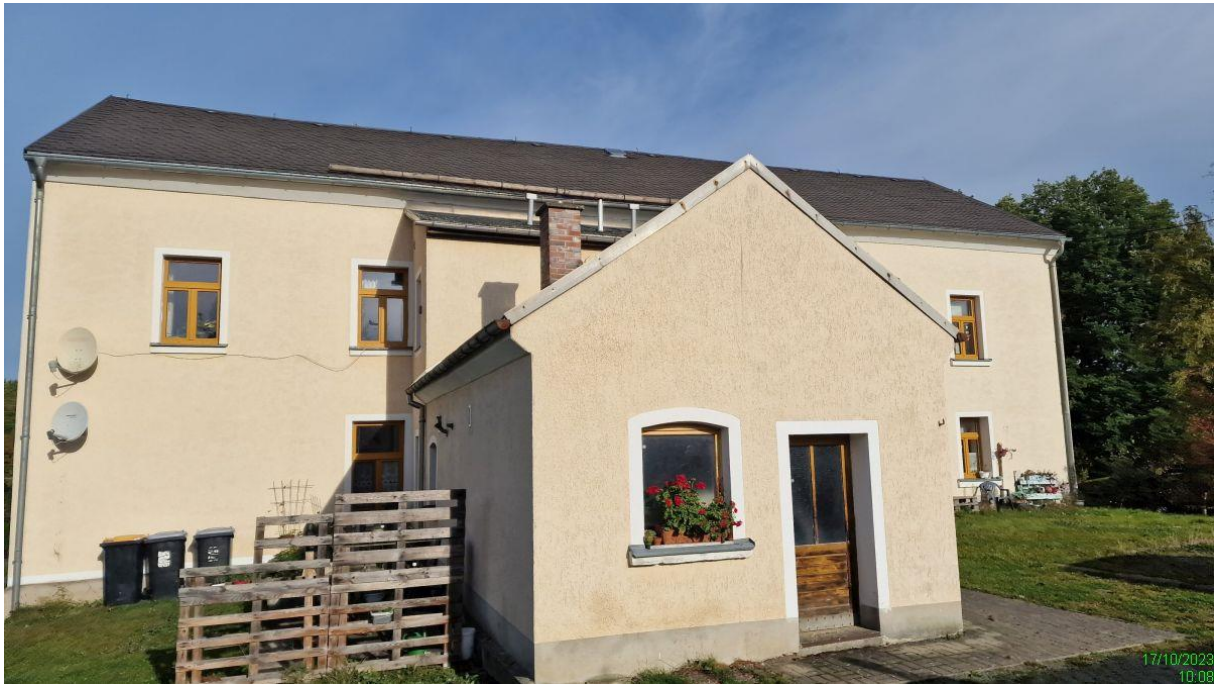
Gebäuderückansicht mit Anbau